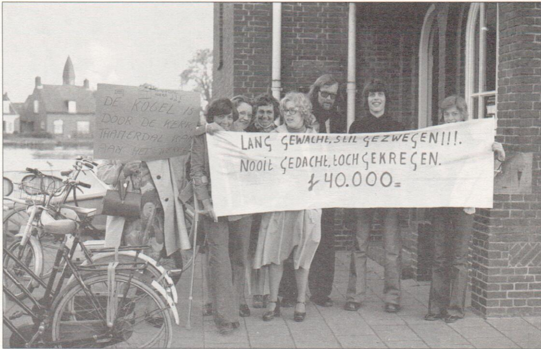
Supporters van Ponderosa verzamelen zich voor het gemeentehuis aan het Marktplaatsje voordat binnen de raadsvergadering over de subsidie voor het buurthuis begint. (Foto Peter Schat, 29 april 1976)